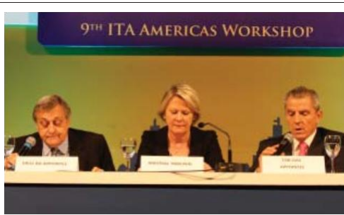
Americas Workshop 2013 en São Paulo

“The content, faculty and overall Workshop quality was excellent.”